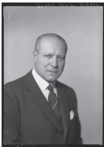
Atilio Dell’ Oro Maini Ministro de Educación y Justicia (septiembre de 1955 – mayo de 1956). 30

Llamamos “Doctrina Universitaria” a aquellas ideas fundamentales que sustentaron las normas aplicadas en la Universidad de Buenos Aires por la Revolución de 1955. Si bien no están compendiadas en un único texto y se encuentran dispersas en discursos y folletos, voy a tomar en consideración a dos referentes del pensamiento universitario en los primeros tiempos: el Ministro de Educación y Justicia, Atilio Dell’ Oro Maini y José Luis Romero 27 al momento de hacerse cargo de la Univesidad de Buenos Aires, aquel 1º octubre de 1955. 28 Ambos condensan, en mi concepto, lo esencial. 29