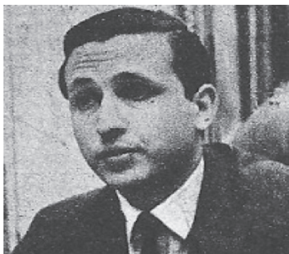
Mariano Grondona. 82