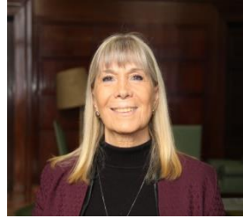
Doctora de la Universidad de Buenos Aires

GRUPO DE TRABAJO INTERDISCIPLINARIO E INTERGENERACIONAL