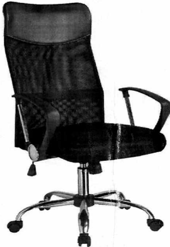
REGLON N° 1