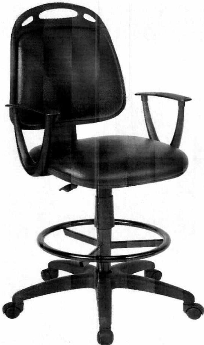
REGLON N° 2